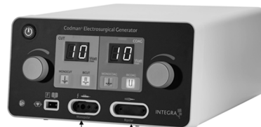
モノポーラ電極接続口 バイポーラ電極接続口