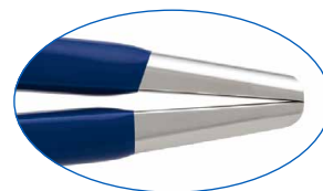
正確なアライメント